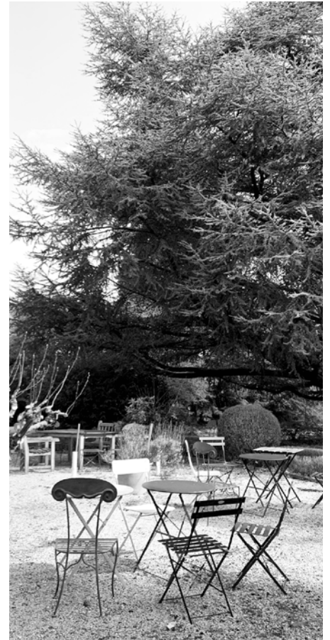
Nouveaux locaux de FAB

À travers un accompagnement global et bienveillant, l'association vise à répondre aux besoins fondamentaux des femmes accueillies, renforcer leur autonomie, préserver leur dignité et favoriser la création de liens sociaux durables.