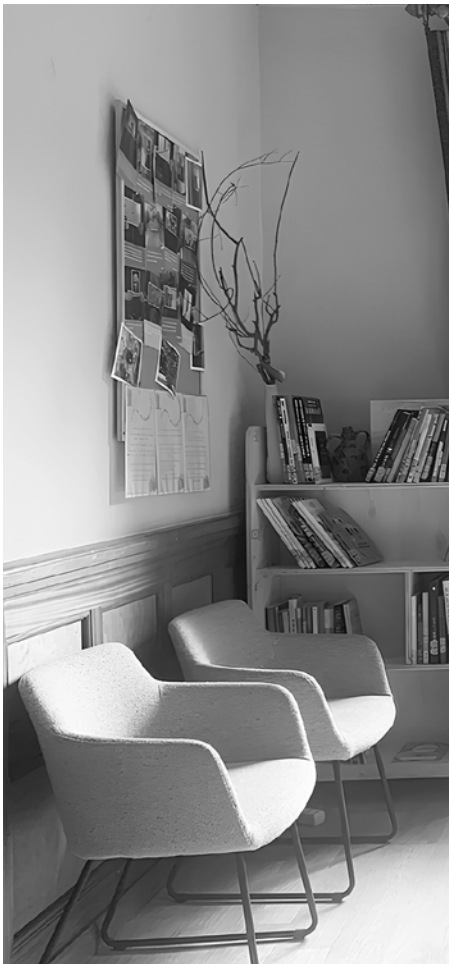
Nouveaux locaux de FAB

Après plusieurs années de recherches, nous avons enfin reçu une nouvelle que nous attendions depuis longtemps : la mise à disposition d'une maison et d'un jardin par la Ville de Genève.