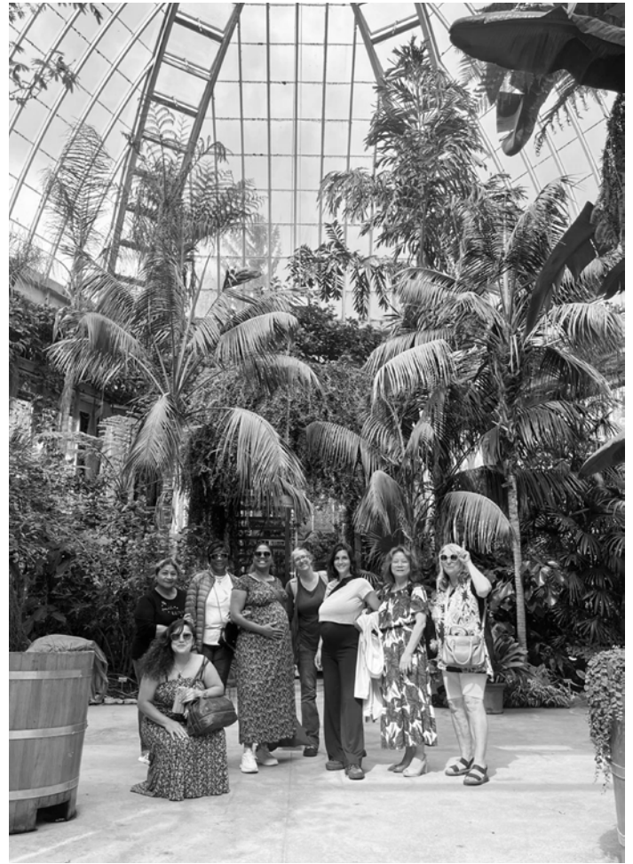
Sortie au Jardin Botanique

Ce projet se clôturera avec le vernissage d'une œuvre collective, en mai 2026.